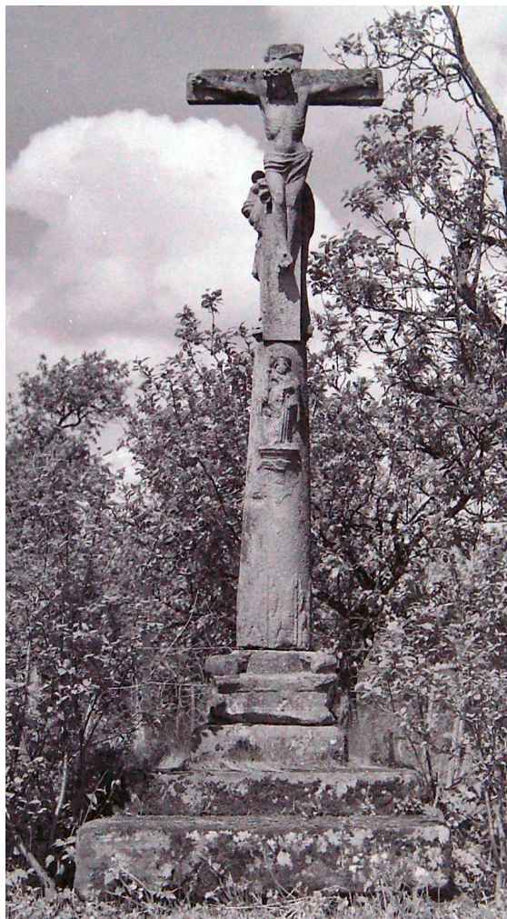
Calvaire des environs de Saint-Dié